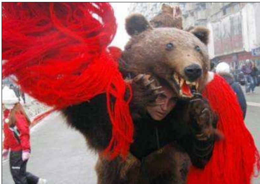
Ursul - mască

Versurile sunt cântate sau strigate de către ursar, punctate de lovituri scurte și ritmice în toabă. Ritmul loviturilor de toabă se schimbă după dorința ursarului, care, prin strigături moi, indică mișcările pe care trebuie să le facă ursul.