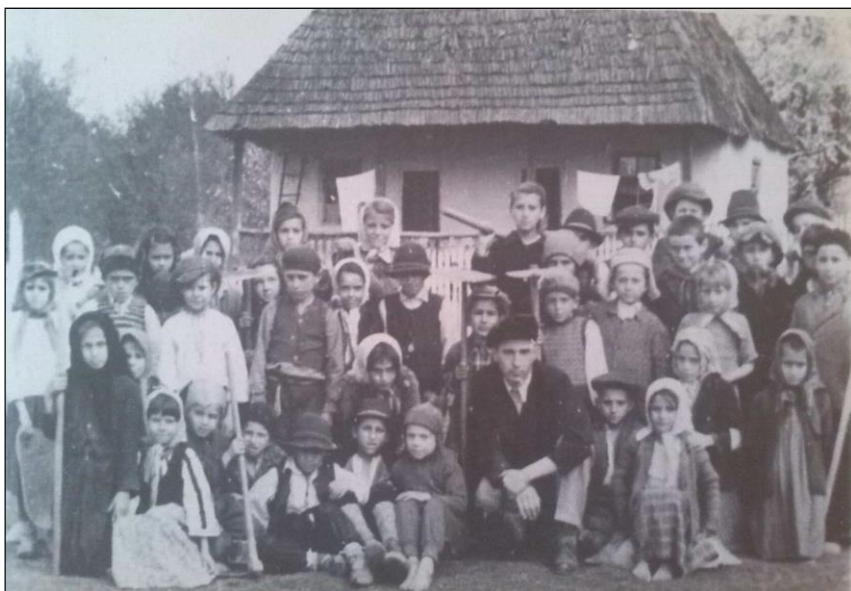
Casă veche, din Cernișoara, cu acoperișul din șindrilă

Înainte de cel de-al II-lea Război Mondial majoritatea caselor cernișorene erau construite din bârne sau furci pârjuite, cu canale cioplite în furcă.