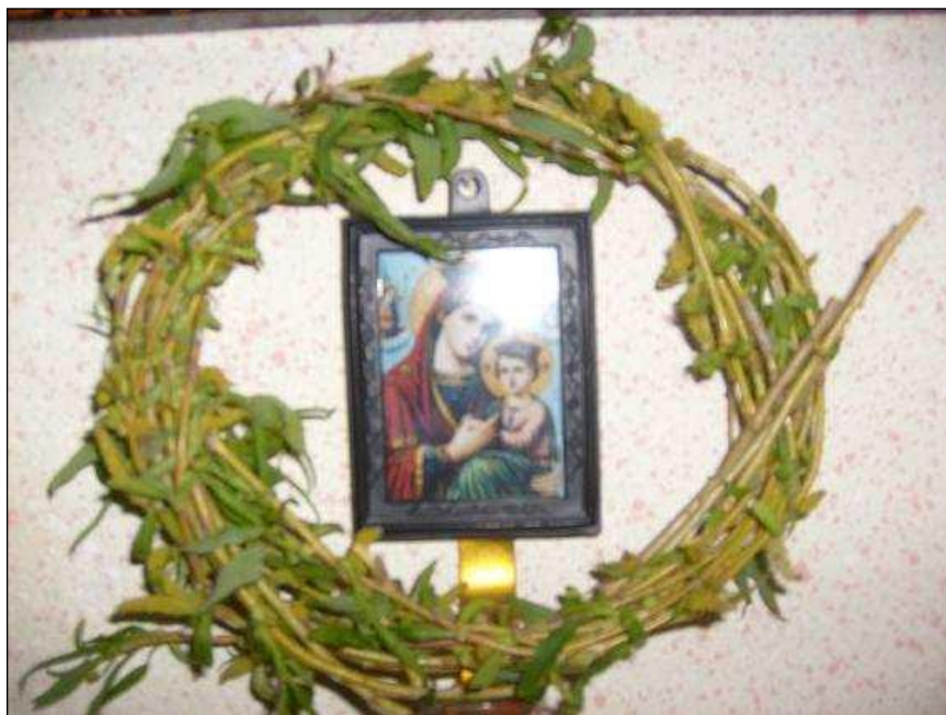
Icoana Maicii Domnului împodobită cu salcie sfințită

Înainte de a intra în Ierusalim, Hristos l-a înviat pe Lazăr. Învierea lui Lazăr este simbolul învierii viitoare a neamului omenesc.