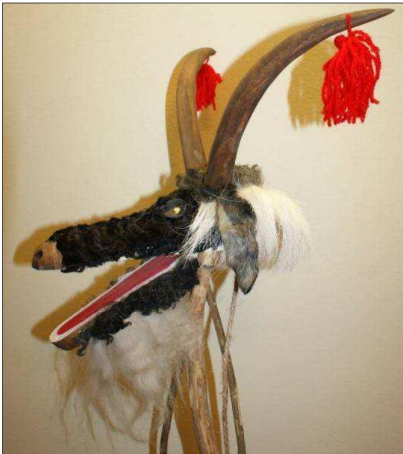
Capra – mască

Ța, Ța, Ța, căpriță, Ța, Te-am adus din Africa, Te-am adus cu avionul, Te-am hrănit cu biberonul.