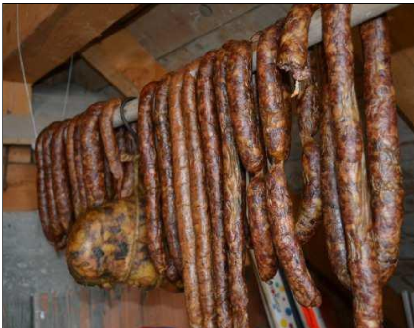
Cârnați și tobă, la afumat, în podul casei

semnalând și apropierea Crăciunului. De-a lungul anilor, această activitate a creat la rândul ei o sumedenie de tradiții și obiceiuri.