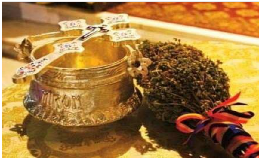
Ustensile preotești folosite la “mersul cu Botezul”

Sărbătoarea Bobotezei este încărcată de ritualuri și tradiții care de-a lungul timpului s-au păstrat neatinsse în satele văii Cernișoarei fiind pline de farmec și semnificații.