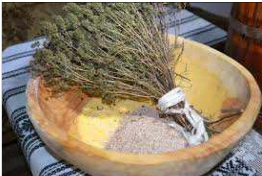
Castron de pământ cu busuioc pentru întâmpinarea preotului