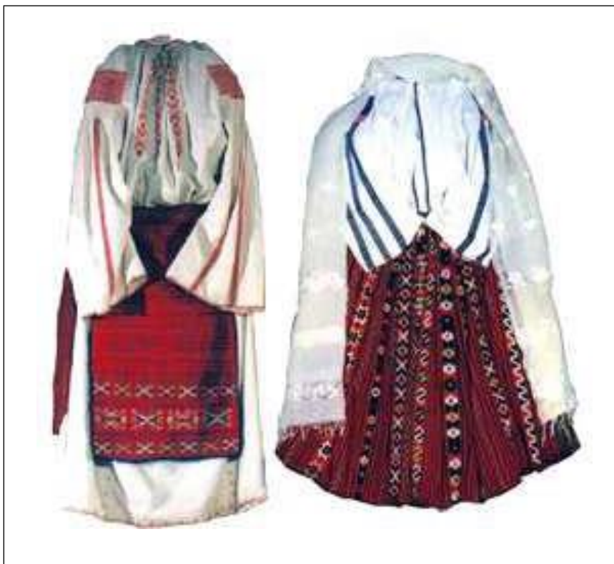
Costume cernișorene femeiești: cu catrințe și zăvelcă

ornamental de pe suprafața acestora, dispus, de obicei, fie vertical, fie orizontal.