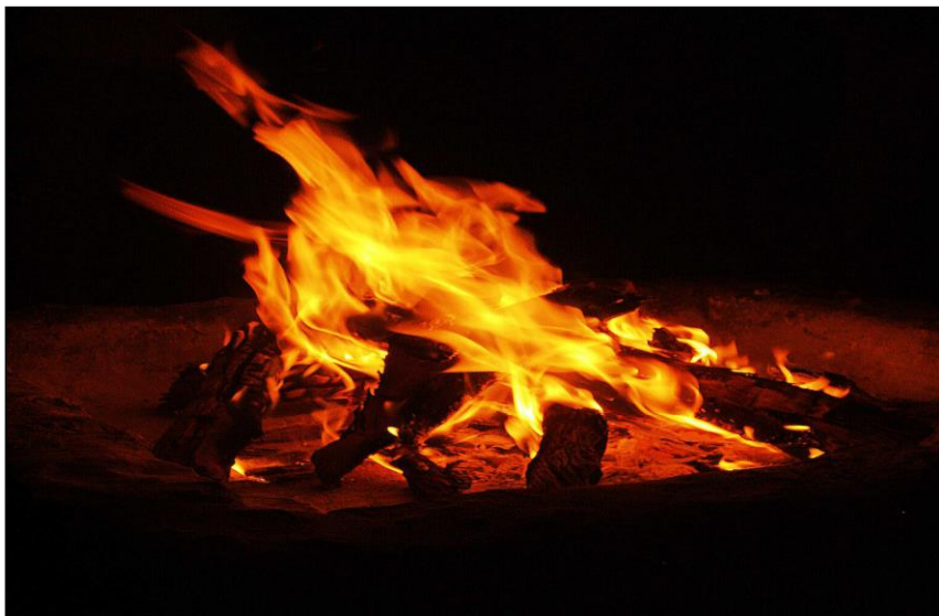
Focul temut și venerat de cernișoreni

Cu mult timp în urmă, focul a fost temut și venerat ca un zeu, dar și domesticit de om. Focul era, în percepția populară, acea bucată de soare pe care cerul a dăruit-o muritorilor pentru a le face viața mai ușoară. În toate colțurile lumii focul a fost personificat sub formă de zei sau personaje fantastice.