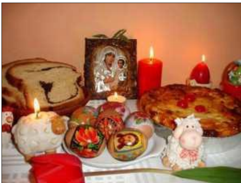
Masă pregătită pentru Sfânta Sărbătoare de Paște

Perioada de dinaintea Sfântului Paști, numită și Săptămâna Patimilor, săptămâna sfântă și binecuvântată, când credincioșii se pregătesc să primească Lumina Învierii, este presărată cu frumoase rânduiești și obiceiuri străvechi, care trebuie ținute din Duminica Floriilor—momentul intrării lui Iisus în Ierusalim și până la răstignirea Sa, în Vinerea Mare.