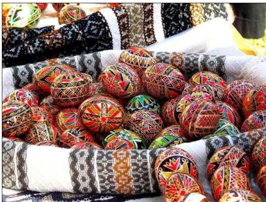
Ouăle înroșite aduc binecuvântare și spor

În prima zi de Paște, dis-de-dimineasă, există obiceiul ca toți cernișorenii, și mai ales fetele, să își clătească obrazul cu apă neînceptută în care au fost puse un ou roșu, o monedă de argint și un fir de urzică. În timp ce își spală fața în această apă, ei