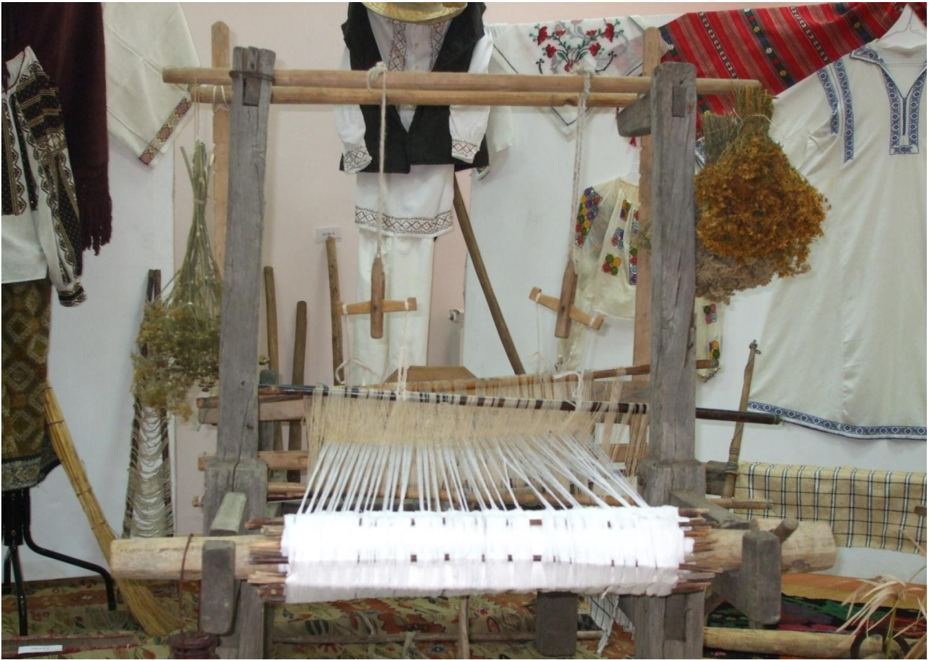
Război de țesut