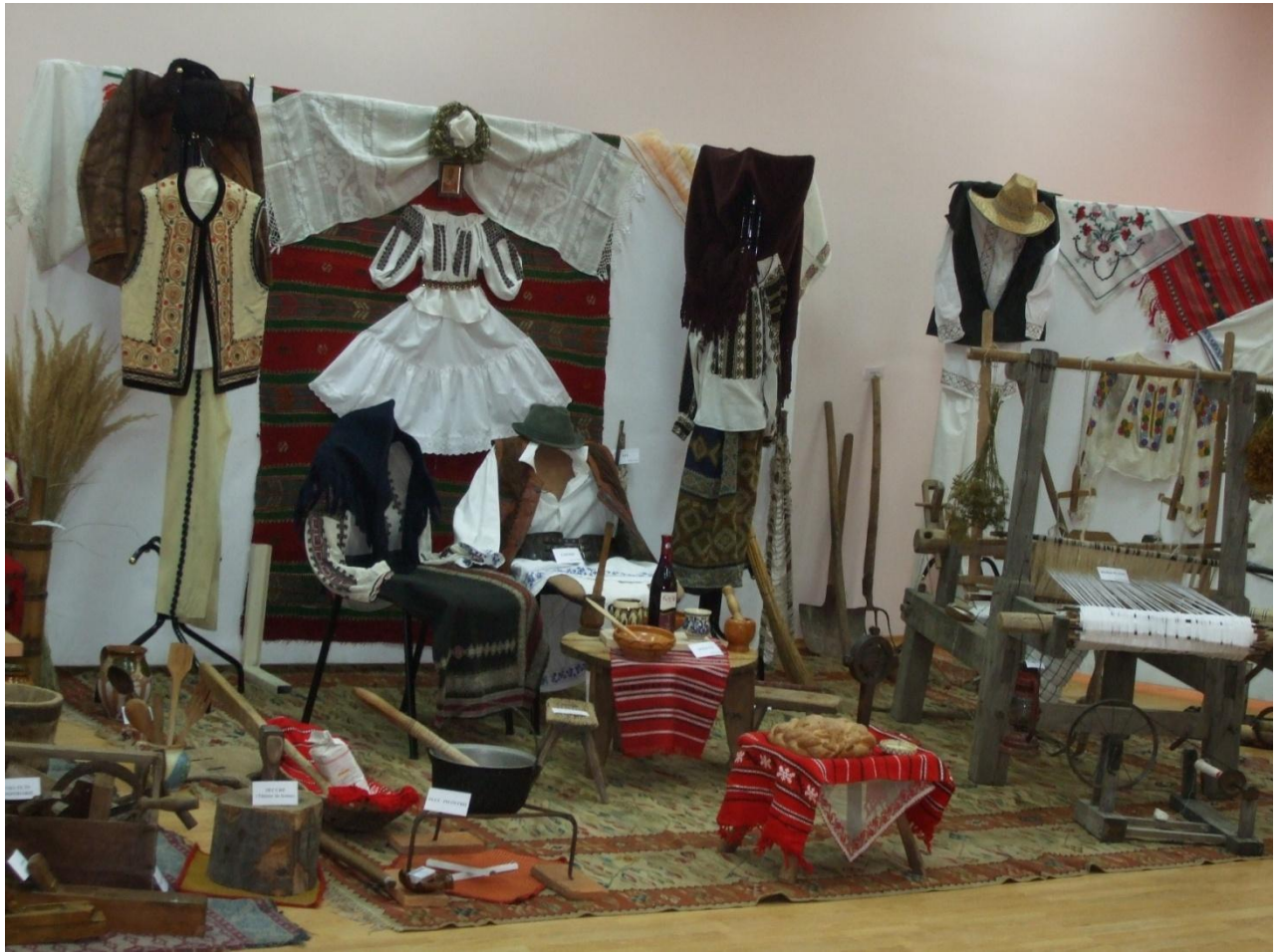
Expoziție obiecte tradiționale